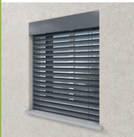
Entre tableau, sous linteau avec lambrequin*

Construction traditionnelle avec isolation par l'intérieur ou l'extérieur