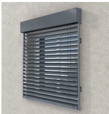
En applique avec lambrequin*