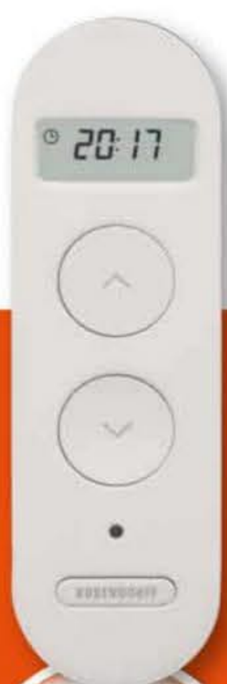
Télécommande horloge et de groupes